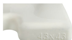
Identificación de las medidas del cojín sobre la espuma.