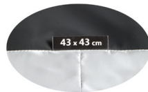
Etiqueta trasera de la funda con las dimensiones.