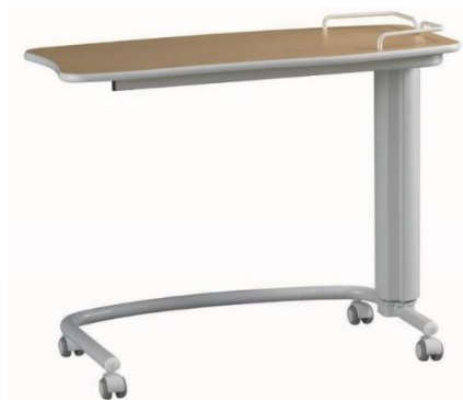
TABLE CONFERENCE T168-00/T169-00