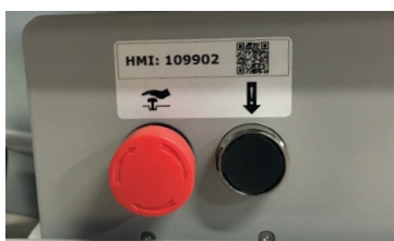
Nødstop og nødfir (separat vare- og HMI-nummer for stol med disse)