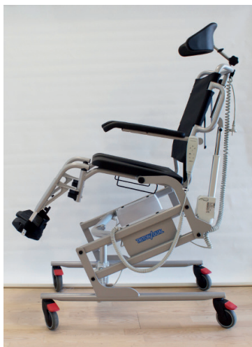
Triton/Dual med elektrisk højdejustering og sæde tilt (baglæns -30 / forlæns +7 grader)