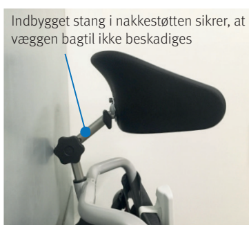
Indbygget stang i nakkestøtten sikrer, at væggen bagtil ikke beskadiges