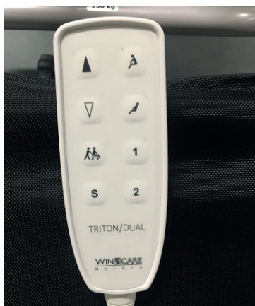
Ny håndbetjening med flere funktioner, fx transportknap og to programmeringsknapper