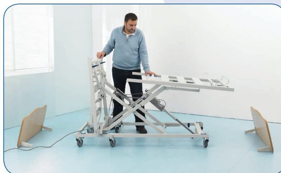
Bloqueo del 1/2 somier de pies en posición horizontal.