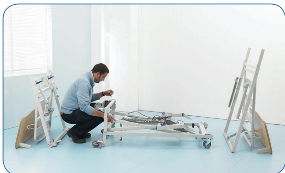
Transformación del carro autoportante en chasis.