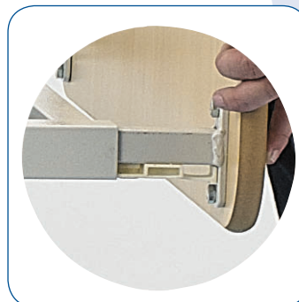
Fijación de los paneles por sistema EASY MOVE: sencillo, rápido y seguro.