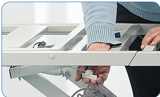
Unión de las 2 mitades del somier con los pasadores.