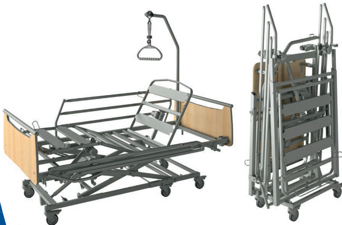
Imágenes no contractuales

• Seguridad: El nuevo sistema de fijación de los paneles "Easy Move" impide la pérdida de tuercas y asegura la fijación de los paneles a la cama. La distribución de los cables reduce la tracción y el riesgo de degradación.