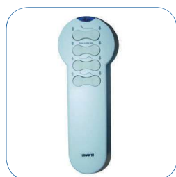
Comando à distância por infravermelhos (opcional).