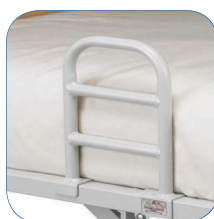
Pega de apoio (disponível como acessório).